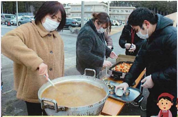
炊き出し訓練(カレー作り)