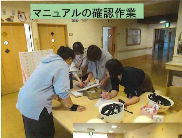
マニュアルの確認作業