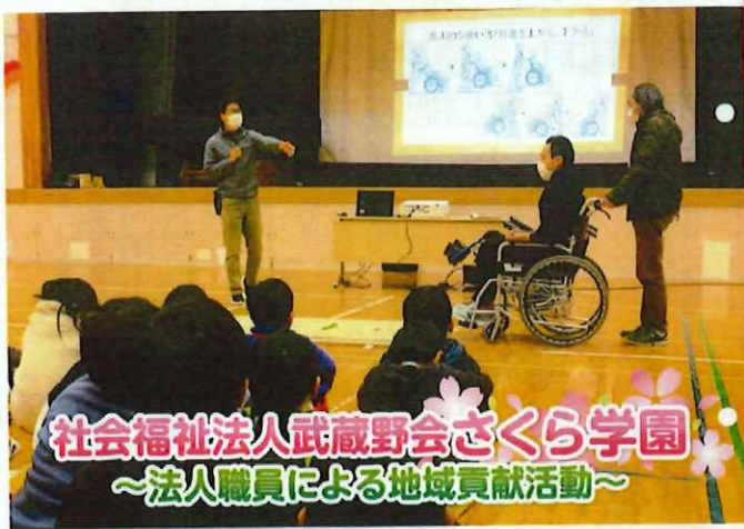
社会福祉法人武蔵野会さくら学園 ～法人職員による地域貢献活動～

御殿場市社会福祉協議会 〒412-0042 御殿場市成増988-1 TEL 0550-706901 HP http://info@gozakyho.jp/ E-mail info@gozakyho.jp