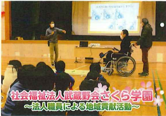
社会福祉法人武蔵野会さくら学園 ～法人職員による地域貢献活動～

令和8年4月20日発行 No.340 御殿場市社会福祉協議会 〒412-0042 御殿場市北原500-1 TEL 0550-70-6504 HP http://www.gyogyo.jp/ E-mail info@gyogyo.jp